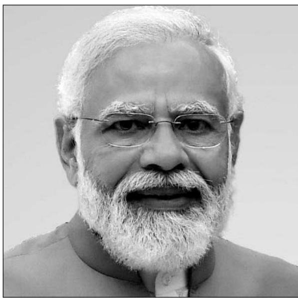
प्रधानमंत्री नरेन्द्र मोदी

महान समाज सुधारक महात्मा फुले का जीवन नैतिक साहस, आत्म चिंतन और समाज के हित के लिए अटूट समर्पण का प्रेरक उदाहरण है