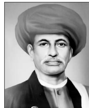
महात्मा ज्योतिबा फुले

हवा। असल में वर्ष 1848 में उनके साथ एक ऐसी घटना घटी जिसने उन्हें झकझोर दिया। वह अपने एक मित्र के विवाह में शामिल होने के लिए गए थे। मित्र उच्च कुल का था और विवाह समारोह में उनके साथ अपमानित व्यवहार हुआ। उन्होंने तभी तय कर लिया जाति व्यवस्था की इस कुप्रथा को वह जड़ से समाप्त करेंगे। यही बाद में हुआ भी। उन्होंने शुरुआत कहीं और से नहीं अपने ही घर से की। दलितों को अपने घर के कुएं को प्रयोग करने की अनुमति दे दी। दलितों और महिलाओं में अंधविश्वास के कारण उत्पन्न हुई आर्थिक और सामाजिक विसंगतियों को दूर करने के लिए भी उन्होंने आंदोलन चलाया। उनका मानना था कि यदि आजादी, समानता, मानवता, आर्थिक न्याय, शोषणरहित मूल्यों और भाईचारे पर आधारित सामाजिक व्यवस्था का निर्माण करना है तो असमान और शोषक समाज को उखाड़ फेंकना होगा। ज्योतिबा फुले युग से आगे की सोच रखते थे, इसीलिए महिला