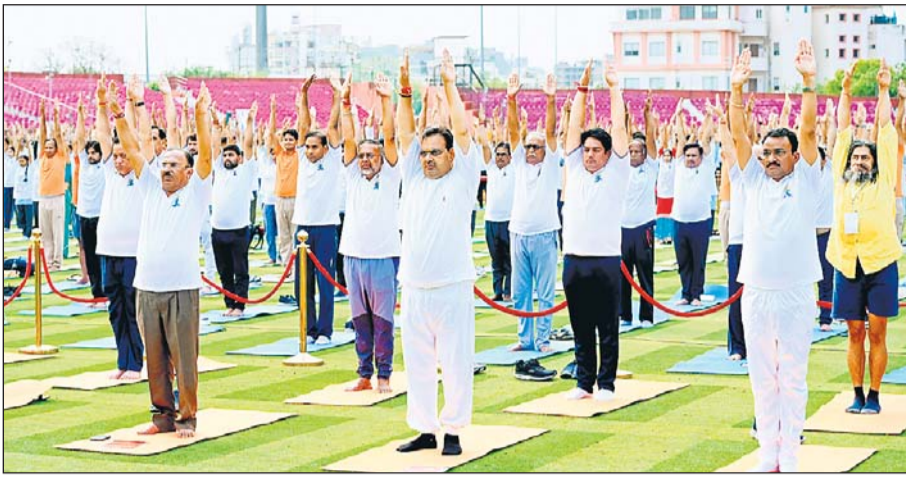
अंतर्राष्ट्रीय योग दिवस पर शुक्रवार को एस.एम.एस. स्टेडियम में आयोजित राज्य स्तरीय समारोह में राज्यपाल कलराज मिश्र, मुख्यमंत्री भजनलाल शर्मा, विधानसभा अध्यक्ष वासुदेव देवनाणी एवं उप मुख्यमंत्री डॉ. प्रेमचंद बैरवा ने भाग लिया।

इस अवसर पर मुख्यमंत्री ने कहा कि योग हमारे प्राचीन ऋषि मुनियों का मानवता को दिया गया अनमोल वरदान है। स्वस्थ जीवन शैली और आदर्श समाज की स्थापना में योग की अहम भूमिका है। उन्होंने कहा कि प्रधानमंत्री