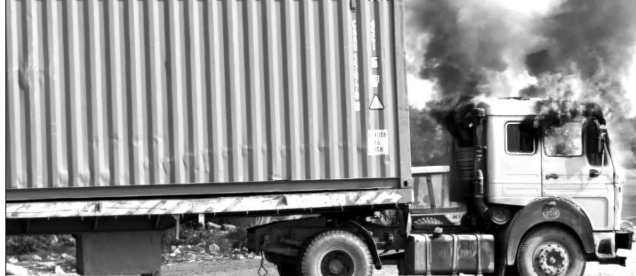
आग लगने के कारण ट्रेलर धू-धू कर जलने लगा।

चौमू/कालाडैरा, (निसं)। मंगलवार दोपहर को एनएच-52 पर स्थित टांटीयावास टोल प्लाजा के पास एक ट्रेलर के केबीन में अचानक आग लग गई। लगते ही ट्रेलर के ड्राइवर व खलासी ने कुदकर अपनी जान बचाई, आग लगने के कारण ट्रेलर धू-धू कर