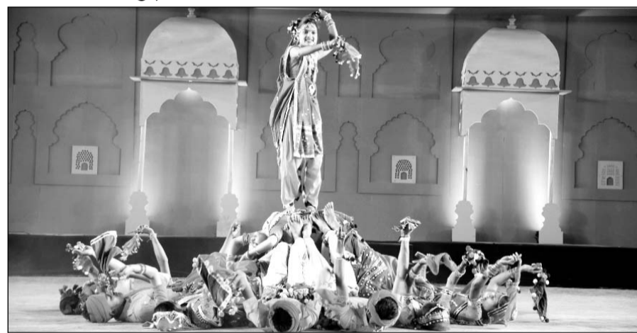
मुक्ताकाशी रंगमंच पर गुजरात के कलाकारों ने चोरवाड़ अंचल का टिप्पणी रास प्रस्तुत किया।

उदयपुर, (कासं)। शिल्पग्राम उत्सव में दिन-ब-दिन यहाँ आने वाले लोगों की संख्या बढ़ती जा रही है। वीकेड पर उदयपुर पहुंचे पर्यटक भी शिल्पग्राम पहुंचे वहीं रविवार को और अधिक लोग इस उत्सव का हिस्सा बनेंगे। इधर, चौथे दिन मुक्ताकाशी रंगमंच पर गुजरात की लखूटी संस्कृति की झलक देखने को मिली।