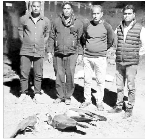
संजय वन में मोरों को लेकर पहुंचे ग्रामीण।

निवाई, (निसं) गांव डोंगरथल में शिकारियों द्वारा लगातार मोर का शिकार करने की घटना से ग्रामीणों में रोष व्याप्त हो रहा है।