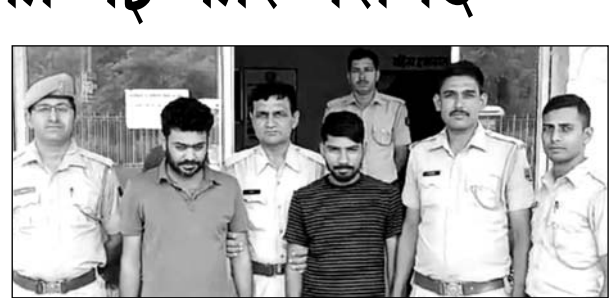
पुलिस ने दो शातिर वाहन चोरों को गिरफ्तार किया।