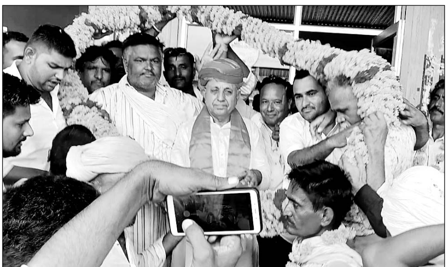
कृषि राज्य मंत्री भागीरथ चौधरी का साफा बंधन कर स्वागत किया।