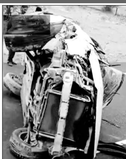
कार हादसे के बाद चकनाचूर हो गई।

जैसलमेर, (निसं)। जैसलमेर में कार पलटने से 2 लोगों की घटनास्थल पर ही मौत हो गई वहीं 2 घायलों को जवाहिर अस्पताल लाया गया। जवाहिर अस्पताल में गंभीर हालत में एक युवक को जोधपुर के लिए रैफर कर दिया वहीं एक युवक को प्राथमिक उपचार के बाद छुट्टी दे दी गई। दोनों मृतकों के शवों को हॉस्पिटल की मोर्चरी में रखवाया गया है।