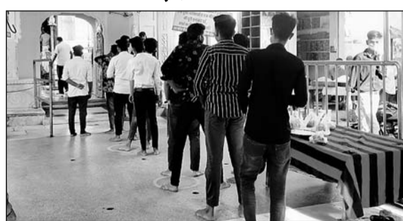
डिग्गी कल्याणजी के दर्शन के लिए लगी श्रद्धालुओं की कतार।