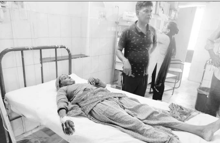
महिला को प्राथमिक उपचार के बाद जयपुर एसएमएस अस्पताल रेफर किया।