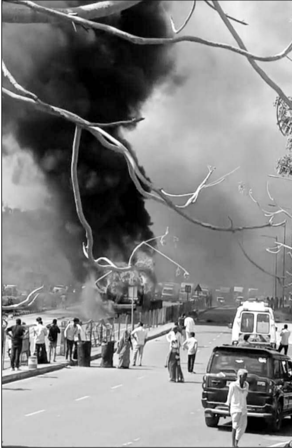
बस में आग लगने के बाद मौके पर लोगों की भीड़ जमा हो गई।

गौरतलब है कि उदयपुर शहर में बीते पांच दिनों में निजी ट्रेवलस की