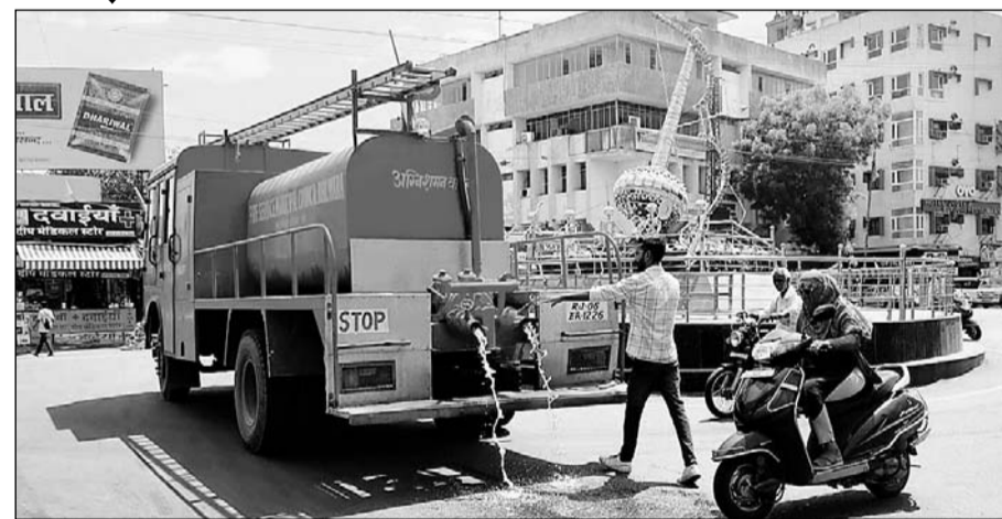
भीलवाड़ा में प्रशासन द्वारा शहर की सड़कों को टंडा रखने के लिए सड़कों पर फायर ब्रिगेड की मदद से पानी का छिड़काव करवाया जा रहा है।

नगर व्यास ने पंचांग के आधार पर बताया कि इस बार देशभर में अच्छी बारिश होगी। राजस्थान में मंडूकछाप यानी कहीं अधिक तो कहीं कम बारिश के योग्य बन रहे हैं। भीलवाड़ा में औसत बारिश होगी। फिलहाल औद्योगिक नगरी में पड़ रही भीषण गर्मी ने शहर की सड़कों को सूना कर दिया है। आमजन रोजमर्रा के कामों