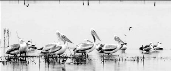
लालसोट के मोरेल बांध में दिखा संकटग्रस्त श्रेणी के डालमेशियन पेलिकन का झुंड।

पर्यटक को एवं स्थानीय लोगों को खुद की ओर आकर्षित कर रहा है। सुबह के समय इस पेलिकन कि जल अठखेलियां अनायास ही लोगों को खुद की ओर आकर्षित कर रही हैं। संकटापन्न श्रेणी के डालमेशियन पेलिकन काउ जैसे तो मोरेल बांध में पिछले साल से आगमन हुआ है लेकिन इधर बार भारी संख्या में यह पक्षी मोरेल बांध में खुद की उपस्थिति दर्ज करा चुका है।