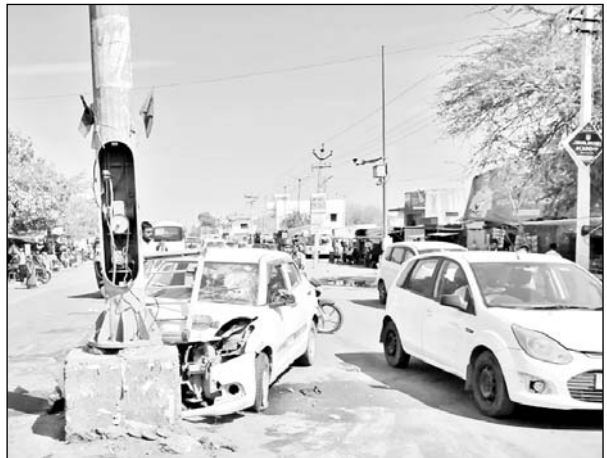
हादसे में कार के आगे का हिस्सा क्षतिग्रस्त हो गया।

जानकारी के मुताबिक झुंझुनू जिले के खेतड़ी उपखंड के रवां गांव के