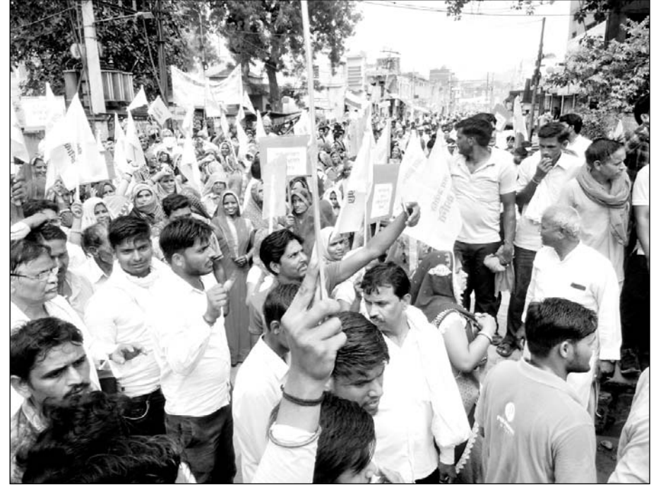
अलवर के राजगढ़ में 12 प्रतिशत अलग से आरक्षण की मांग को लेकर सैनी समाज ने रैली निकाली।

सैनी समाज के हजारों लोगों ने रैली निकाल कर प्रदर्शन किया