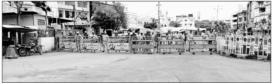
उदयपुर में कर्फ्यूग्रस्त इलाकों व शहर में चप्पे-चप्पे पर पुलिस बल तैनात रहा।