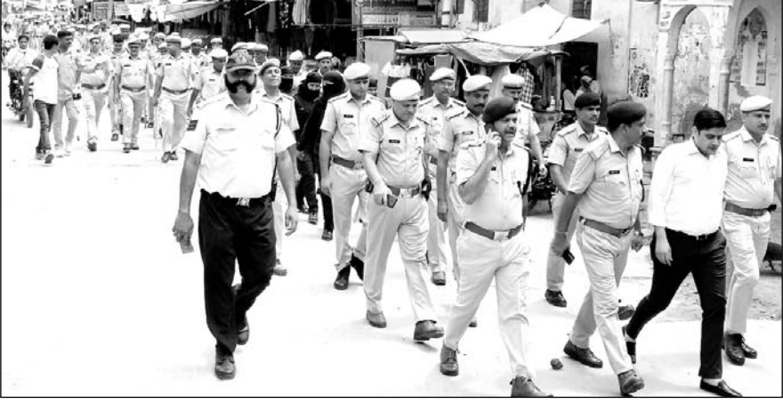
टोंक जिला मुख्यालय पर पुलिस द्वारा निकाले गए फ्लैग मार्च में जिले के आलाधिकारी भी शामिल रहे।

उदयपुर में हुई वीभत्स हत्या के बाद प्रशासन अलर्ट मोड पर