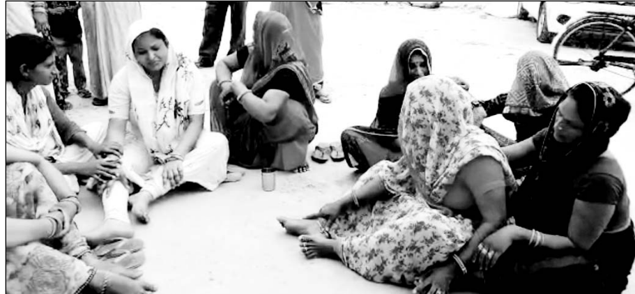
प्रसूता की मौत के बाद शोक में डूबा परिवार।

■ डॉक्टर परिजनों से ब्लड की व्यवस्था करने की कहते रहे और प्रसूता की मौत हो गई