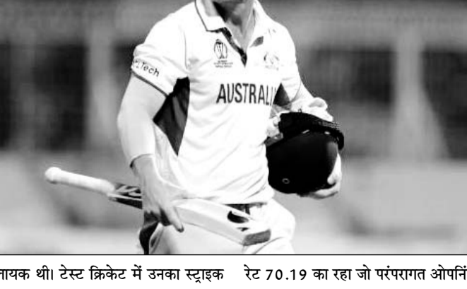
लायक थी। टेस्ट क्रिकेट में उनका स्ट्राइक रेट 70.19 का रहा जो परंपरागत ओपनिंग

नई दिल्ली, 15 जुलाई। ऑस्ट्रेलिया के दिग्गज बल्लेबाज डेविड वॉर्नर ने अंतरराष्ट्रीय क्रिकेट के सभी प्रारूपों से संन्यास की घोषणा कर दी थी। हालांकि उन्होंने साल 2025 में होने वाली चैंपियंस ट्रॉफी के लिए अपने दरवाजे खुले रखे थे, लेकिन अब ऑस्ट्रेलिया टीम के राष्ट्रीय चयनकर्ता जॉर्ज बेली ने साफ किया है कि चैंपियंस ट्रॉफी के लिए वॉर्नर के नाम पर विचार नहीं किया जाएगा। बाएं हाथ के शानदार ओपनर रहे वॉर्नर के करियर पर एक नजर डालते हैं। डेविड वॉर्नर ने अपने अंतरराष्ट्रीय करियर में 112 टेस्ट मैच, 161 वनडे और 110 टी20 अंतरराष्ट्रीय मैच खेले। उन्होंने टेस्ट मैचों में 26 शतक और 44.56 की औसत के साथ 8786 रन बनाए। वनडे में उन्होंने 22 शतक के साथ 6932 रन बनाए। इन दोनों फॉर्मेट में उनके रन बनाने की तेजी देखने