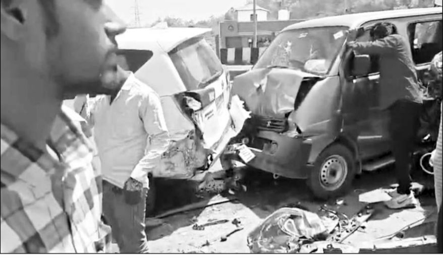
हादसे के बाद मौके पर पहुंचे लोगों ने घायलों को गाड़ियों से निकाला।

बताया जा रहा है कि हादसे में कई लोग घायल हुए हैं, बाइक सवार युवक भी गंभीर घायल, नौ लोग हॉस्पिटल में भर्ती