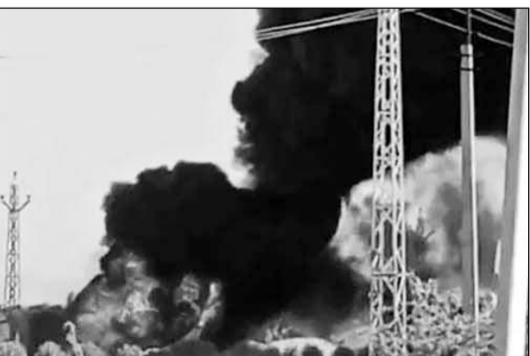
आग की लपटें दूर तक दिखाई दीं। वहीं दमकल कर्मियों ने करीब डेढ़ घंटे की कड़ी मशक्कत के बाद आग पर काबू पाया।