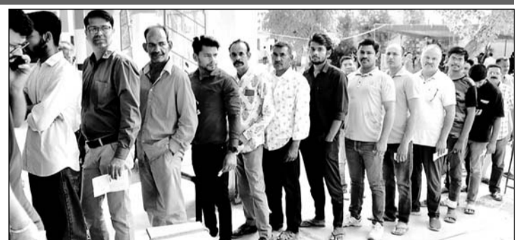
जयपुर के मतदान केंद्रों पर सुबह 6 बजे से ही वोटिंग के लिए लोगों की कतारें लगना शुरू हो गईं। सुबह 7 बजे जैसे ही वोटिंग शुरू हुई तो लोगों ने बारी-बारी से अपने प्रत्याशियों के पक्ष में मतदान किया।

जयपुर, (का.सं.)। लोकतंत्र के उत्सव में भागीदारी निभाने के लिए बुजुर्गों से लेकर युवाओं ने उत्साह दिखाया। शुक्रवार को प्रदेश के 12 लोकसभा क्षेत्रों में हुए मतदान को लेकर निर्वाचन विभाग ने खास इंतजाम किए थे। जयपुर शहर और जयपुर ग्रामीण क्षेत्र में लोग उत्साह के साथ वोट डालने पहुंचे। "अंगुली पर स्थाई" के साथ सेल्फी स्टैंड पर फोटो खींचवाने को लेकर युवाओं में काफी उत्साह दिखाई दिया। निर्वाचन विभाग के आंकड़ों के मुताबिक इस बार जयपुर ग्रामीण में 56.58 और जयपुर शहर में 62.87 फीसदी मतदान हुआ, जबकि वर्ष 2019 में इन दोनों जगहों पर क्रमशः 65 व 68.11 प्रतिशत वोटिंग हुई थी। यानि कि इस बार जयपुर शहर में पिछली बार की तुलना में 5.24 और जयपुर ग्रामीण में 8.42 प्रतिशत वोट कम डाले गए। इस कारण नेताओं से लेकर उनके समर्थकों के दिलों की धड़कनें तेज हैं। पूरे राजस्थान में वोट प्रतिशत गिरने का एक बड़ा कारण गर्मी को माना गया है, लेकिन शुरुआती मतदान के समय में सुबह के 4 घंटे में भी मतदान प्रतिशत 21 प्रतिशत ही रहा था। तभी संकेत मिल गया था कि राजस्थान में इस की जानकारी मिली। चोर रात करीब 1:45 बजे दुकान में घुसता दिखाई दे रहा है। पीड़ित ने बताया कि 10 अप्रैल को भी मेरी दुकान में चोरी हुई थी।