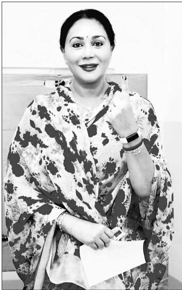
उपमुख्यमंत्री दिया कुमारी ने परकोटे में गणगौरी बाजार में जनाना ड्योडी स्थित एक स्कूल में मतदान किया।