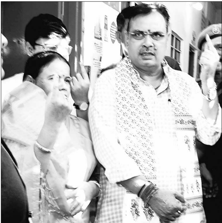
मुख्यमंत्री भजनलाल शर्मा शुक्रवार को प्रातः लोकसभा आम चुनाव 2024 के प्रथम चरण के तहत हो रहे मतदान के लिए सिद्धार्थ नगर के नवोदय महिला शिक्षक प्रशिक्षण महाविद्यालय मतदान केंद्र पहुंचे। उन्होंने मतदान केंद्र पर सपरिवार मतदान किया।