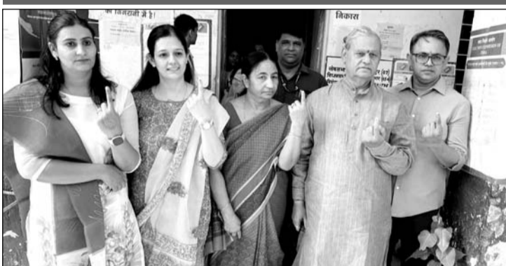
जयपुर सांसद रामचरण बोहरा ने परिवार के साथ दुर्गापुरा स्थित राजकीय बालिका स्कूल में मतदान किया।

जयपुर में लोकसभा चुनाव में मतदान को लेकर उत्साह दिखा, फिर भी वोटिंग प्रतिशत वर्ष 2019 के मुकाबले कम रहा