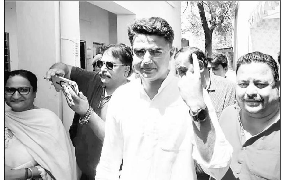
पूर्व उपमुख्यमंत्री सचिन पायलट ने शुक्रवार को जयपुर में सी-स्कीम स्थित सरदार पटेल मार्ग पर रेजिडेंसी स्कूल में अपना वोट डाला।