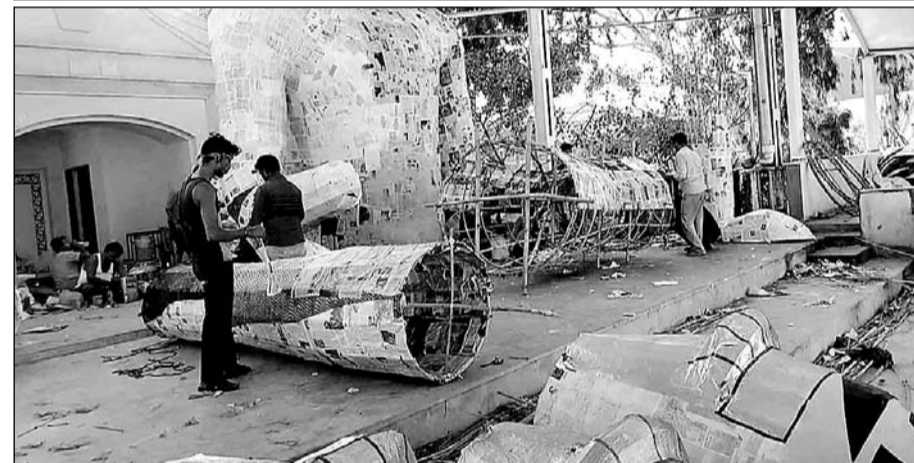
अजमेर शहर में दशहरा महोत्सव को लेकर रावण के पुतलों का निर्माण करते कारीगर।

अजमेर में तीस साल से मुस्लिम कारीगर रावण का पुतला बनाते आ रहे हैं