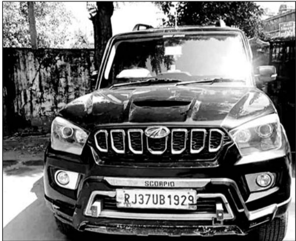
पुलिस द्वारा जब्त की गई गाड़ी।