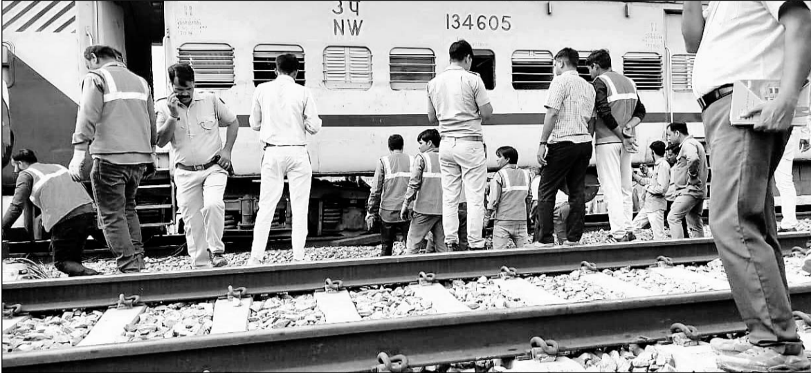
अजमेर में अरावली एक्सप्रेस के एक डिब्बे के दो पहिए पटरी से उतरने के बाद टीम ने डिब्बे को पुनः पटरी पर चढ़ाया।

अजमेर, (कास)। अरावली एक्सप्रेस के एक डिब्बे के दो पहिए पटरी से उतर गये। रेल कर्मियों ने तत्परता दिखाते हुए शीघ्रता से उतरे डिब्बे को पुनः चढ़ा कर रेल यातायात बहाल किया। जानकारी के अनुसार