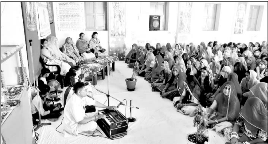
धोरीमन्ना के आदर्श विद्या मंदिर में मातृ शांति सम्मेलन का आयोजन हुआ।