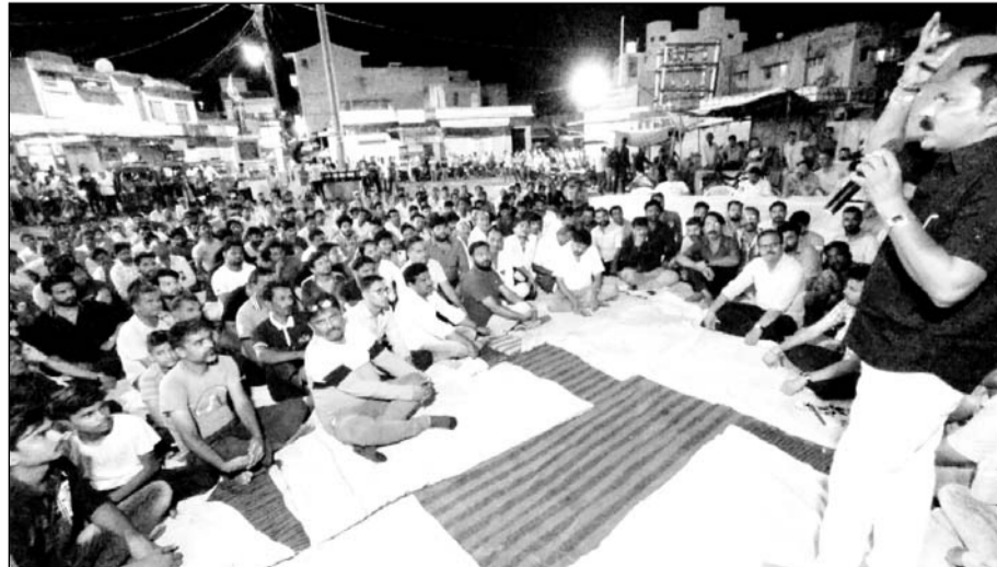
जालोर के वीरमदेव चौक में व्यापार मंडल की बैठक आयोजित हुई।

जालोर में व्यापार मंडल व द जनरल मर्चेंट एसोसिएशन के बीच विवाद बढ़ने के बाद बुधवार रात्रि को व्यापारियों की आम सभा का आयोजन किया गया। जिसमें जालोर शहर के समस्त व्यापारियों ने भाग लिया। जालोर शहर के वीरमदेव चौक में व्यापारियों की काफी भीड़ नजर आई। जालोर में व्यापारियों के दो संगठन सामने आने पर विवाद बढ़ता देख बैठक के वीरमदेव चौक में व्यापारियों की काफी भीड़ नजर आई। जालोर में व्यापारियों के दो संगठन सामने आने पर विवाद बढ़ता देख बैठक के वीरमदेव चौक में व्यापारियों की काफी भीड़ नजर आई।