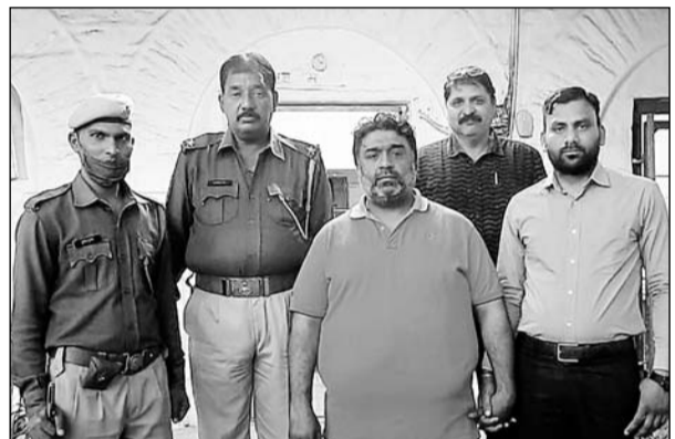
राजसमंद में राजनगर थाना पुलिस ने मारपीट एवं धोखाधड़ी कर रूपए हड़पने के मामले में फरार चल रहे आरोपी को गिरफ्तार किया।