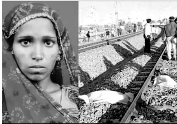
ब्यावर में हादसे के बाद पुलिस मौके पर पहुंची और जांच की।