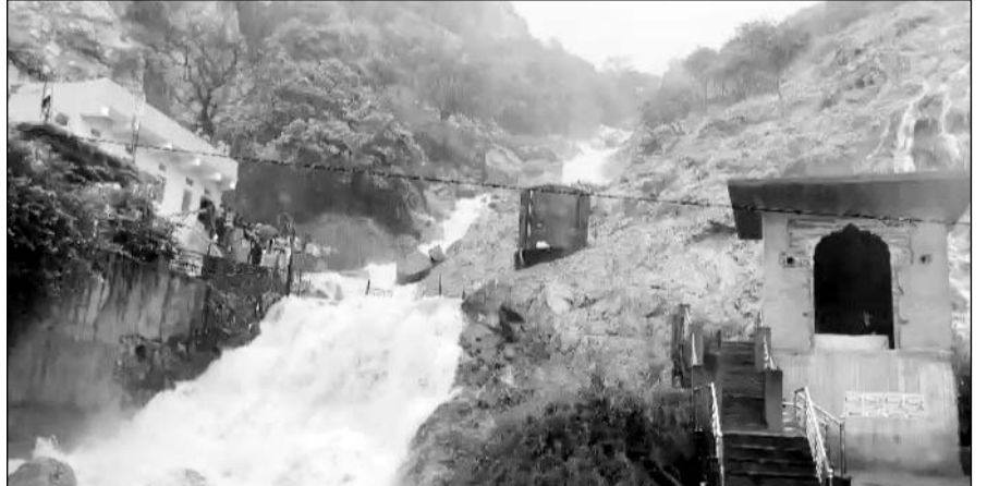
बरसात से सामोद के पास महार कलां स्थित मालेश्वर धाम की पहाड़ियों से नदी बहती नजर आई।

■ सामोद के वीर हनुमान जी मंदिर के पास स्थिति पहाड़ों से नदियों का पानी निकल पड़ा