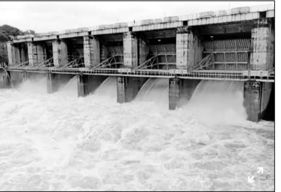
पांचना बांध के पांच गेट खोलकर पानी की निकासी की जा रही है।

इसी प्रकार वार्ड नंबर 44 में डांगरिया तालाब के ओवरफ्लो होने के चलते उसकी पाल तोड़कर पानी की निकासी की गई एवं माथुर स्टेडियम कि बाउंड्री, पावर हाउस की चारदीवारी ढह गई। करौली-मंडरायल मार्ग स्थित कई कॉलोनी में जलभराव से लोगों में आक्रोश है। आक्रोशित क्षेत्रवासियों ने