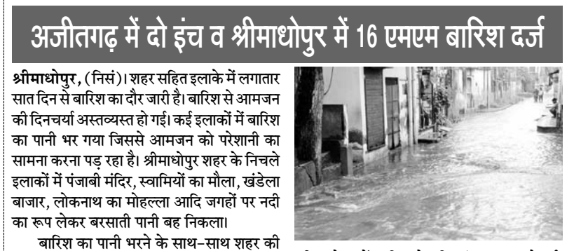
अजीतगढ़ में दो इंच व श्रीमाधोपुर में 16 एमएम बारिश दर्ज

श्रीमाधोपुर, (निर्स)। शहर सहित इलाके में लगातार सात दिन से बारिश का दौर जारी है। बारिश से आमजन की दिनचर्या अस्तव्यस्त हो गई। कई इलाकों में बारिश का पानी भर गया जिससे आमजन को परेशानी का सामना करना पड़ रहा है। श्रीमाधोपुर शहर के निचले इलाकों में पंजाबी मंदिर, स्वामियों का मौला, खंडेला बाजार, लोकनाथ का मोहल्ला आदि जगहों पर नदी का रूप लेकर बरसाती पानी बह निकला।