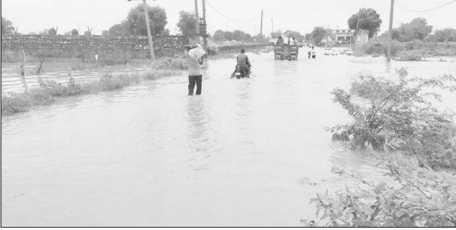
हिण्डौन सिटी शहर सहित आसपास के क्षेत्र में बारिश से कई इलाके जलमग्न हो गए।