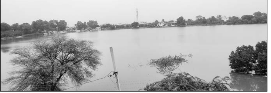
चाकसू कस्बे के बीचों-बीच स्थित मनहोरा तालाब ओवरफ्लो हो गया।

चाकसू, (निर्स)। मौसम विभाग की चेतावनी के मुताबिक क्षेत्र में तीन दिनों से लगातार बारिश हो रही है। आसमान से बरस रहे पानी से विधानसभा क्षेत्र के अधिकांशतः तालाब ओवरफ्लो हो गए हैं। बारिश से नगर पालिका क्षेत्र के निचले इलाकों और कच्चे-पक्के रास्तों में पानी भर गया है। बहुत से आम रास्ते तो कीचड़ में पड़े हैं जिससे लोगों का आवागमन दुश्वार हो गया है।