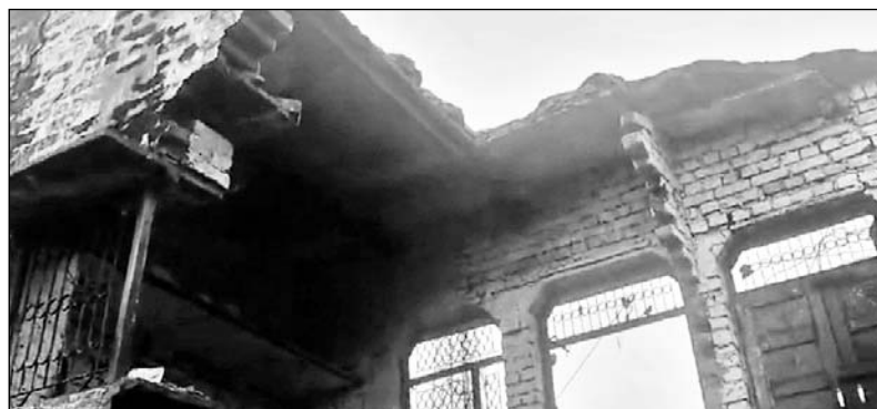
जुरहारा थाना क्षेत्र के गांव गांवड़ी में तेज बारिश से मकान गिर गया।

कामां, (निर्स)। जुरहारा थाना क्षेत्र के गांव गांवड़ी में तेज बारिश होने के कारण भरभराकर मकान गिर गया, जिसमें एक महिला और बच्ची की दबने से मौत हो गई तो वहीं एक व्यक्ति का पैर भी टूट गया और एक बच्ची की गंभीर हालत बताई जा रही है, जिसको अस्पताल में भर्ती कराया गया है।