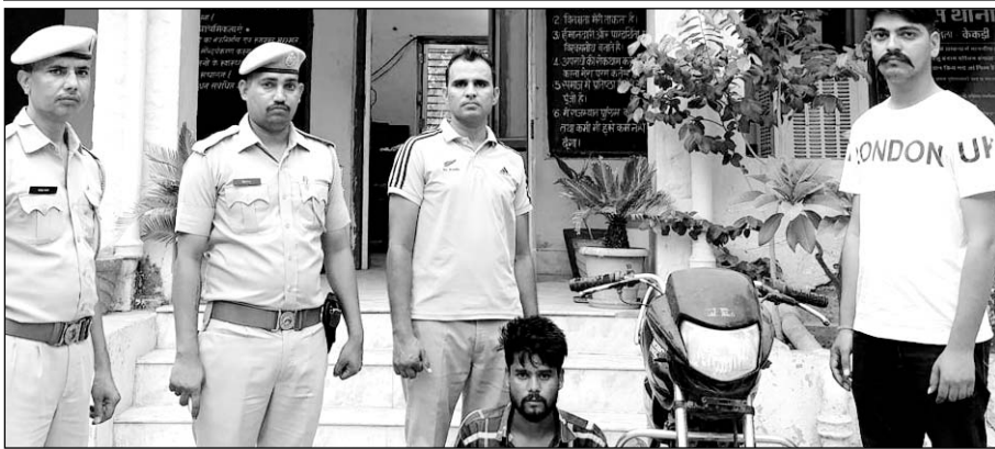
पुलिस टीम ने फरार आरोपी को गिरफ्तार किया।

पुलिस ने आरोपी के पास अवैध देशी कट्टा एवं चोरी की बाइक भी बरामद की