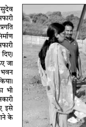
विधानसभा अध्यक्ष वासुदेव देवनानी ने निर्माणाधीन काजीपुरा लैपर्ड सफारी का निरीक्षण कर विभिन्न विकास कार्यों की प्रगति का जायजा लिया।

अजमेर, (निसं)। विधानसभा अध्यक्ष वासुदेव देवनानी ने निर्माणाधीन काजीपुरा लैपर्ड सफारी का निरीक्षण कर विभिन्न विकास कार्यों की प्रगति का जायजा लिया। उन्होंने अधिकारियों को निर्माण कार्यों में तेजी लाकर इस वर्ष के अंत तक सफारी को आमजन के लिए शुरू करने के निर्देश दिए। देवनानी ने सफारी परिसर में विकसित किए जा रहे टिकट काउंटर, मुख्य द्वार, प्रशासनिक भवन तथा अन्य निर्माणाधीन कार्यों का निरीक्षण किया। उन्होंने चौकियों और निगरानी टावरों का भी अवलोकन कर सुरक्षा व्यवस्थाओं की जानकारी ली। सफारी मार्ग का निरीक्षण करते हुए इसे पर्यटकों के अनुकूल और सुव्यवस्थित बनाने के निर्देश दिए।