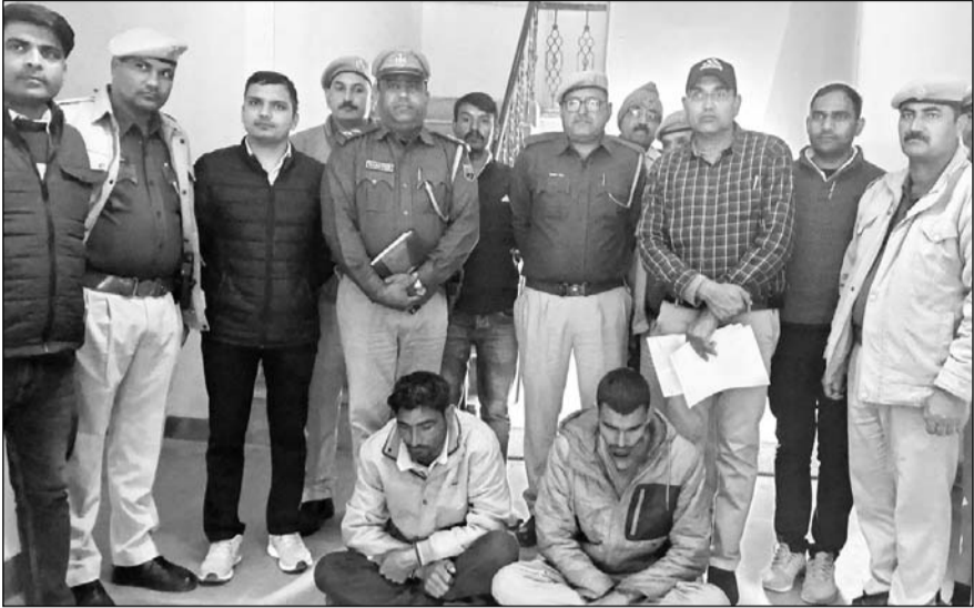
साइबर फील्ड अभियान के तहत साइबर सेल और गच्छीपुरा थाना पुलिस ने कार्रवाई की।