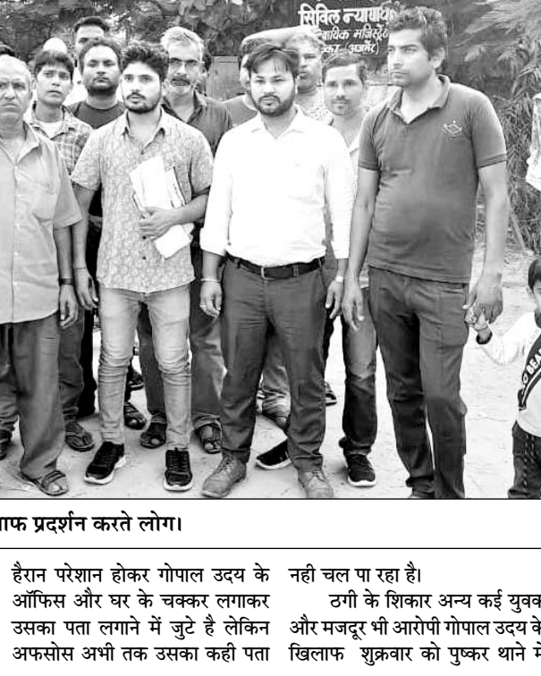
पुष्कर में घिटफंड कंपनी के खिलाफ प्रदर्शन करते लोग।