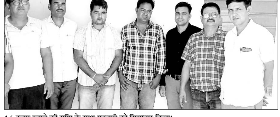
16 हजार रुपये की राशि के साथ पटवारी को गिरफ्तार किया।

मालपुरा/टोंक, (निस)। भ्रष्टाचार निरोधक ब्यूरो टोंक की टीम ने कार्यवाही करते हुए एक पटवारी को 16 हजार रुपये की रिश्वत लेते रंगे हाथों गिरफ्तार किया है। आरोपी पटवारी परिवारी से उसके खातेदारी भूमि का सीमा ज्ञान कर पत्थरगढ़ी करने की एवज में 20 हजार रुपये की रिश्वत की मांग कर परेशान कर रहा था। भ्रष्टाचार निरोधक निरोधक ब्यूरो टोंक टीम ने परिवारी की शिकायत की