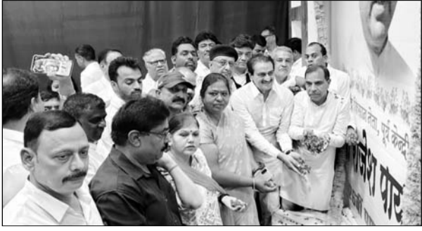
श्रद्धांजलि सभा में कांग्रेसजनों ने राजेश पायलट की तस्वीर पर पुष्पांजलि अर्पित कर उनके योगदान को स्मरण किया।

अजमेर, (निर्स)। पूर्व केंद्रीय मंत्री एवं कांग्रेस के वरिष्ठ नेता स्वर्गीय राजेश पायलट की 26वीं पुण्यतिथि पर गुरुवार को अजमेर में कांग्रेस नेताओं एवं कार्यकर्ताओं ने श्रद्धांजलि सभा आयोजित कर उन्हें भावभीनी श्रद्धांजलि अर्पित की। इस अवसर पर कांग्रेस नेताओं ने उनकी तस्वीर पर पुष्पांजलि अर्पित कर उनके योगदान को स्मरण किया तथा उनके आदर्शों और विचारों को जन-जन तक पहुंचाने का संकल्प लिया।