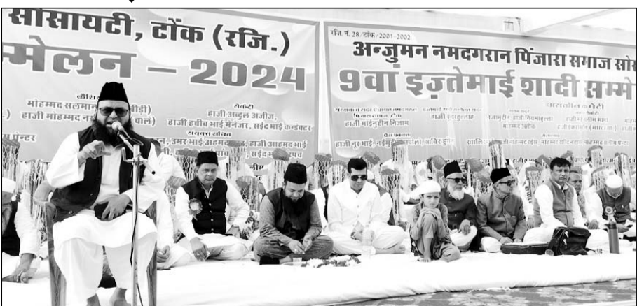
अंजुमन नमदगरान पिंजारा समाज सोसायटी टोंक ने 54 जोड़ों का निकाह कराया।