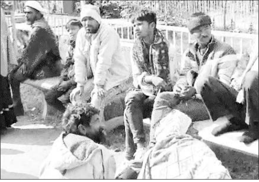
परिजनों की मौजूदगी में शवों का पोस्टमार्टम कराया गया।