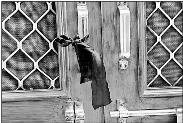
हिंदू समाज के लोगों ने घरों के बाहर विरोधस्वरूप काली पट्टियां बांधी।

जानकारी के अनुसार उपनगर सांगानेर में दो दिन पहले गणेश पंडाल पर कुछ लोगों ने पथराव किया, जिससे माहौल गरमा गया था। बीती रात को भी सकल हिंदू समाज के लोगों ने कार्यवाही और कुछ मार्गों को लेकर पुलिस चौकी का घेरा किया, देर रात तक कोई समझौता नहीं हो पाया और सकल हिंदू समाज ने फैसला किया कि वह दूसरे पक्ष के त्योंहार को नहीं देखेंगे। इसी के चलते सोमवार सुबह काली मंगरी चले गए, जहां वह भजन कीर्तन कर रहे हैं और सामूहिक भोज का आयोजन किया