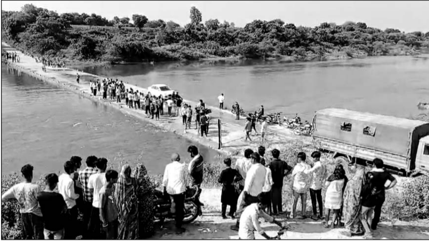
मांडलगढ़ में बीगोद के पास बनास नदी में बहे मां-बेटे के शव 21 घण्टे बाद मिले।