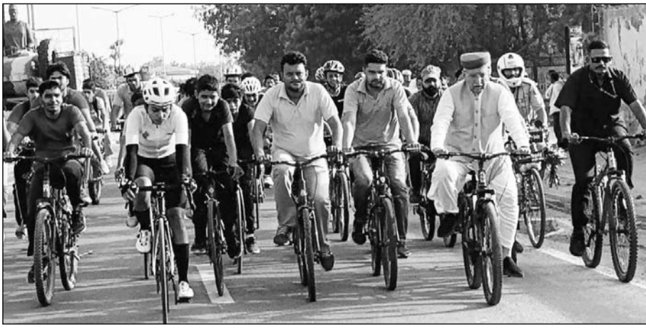
विश्व साइकिल दिवस के उपलक्ष में केन्द्रीय मंत्री अर्जुनराम मेघवाल ने मेरी साइकिल-मेरा हेल्मेट अभियान के तहत खुद साइकिल चलाकर रैली को रवाना किया।