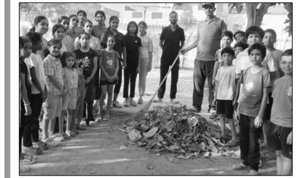
योग एवं खेलकूद संस्कार शिविर में बच्चों ने दीनदयाल पार्क में श्रमदान कर सफाई की।