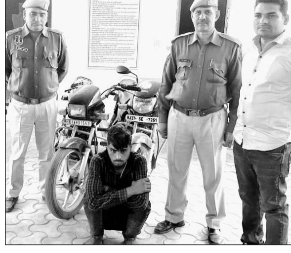
मालपुरा गेट थाना पुलिस ने दुपहिया वाहन चोर को गिरफ्तार किया।