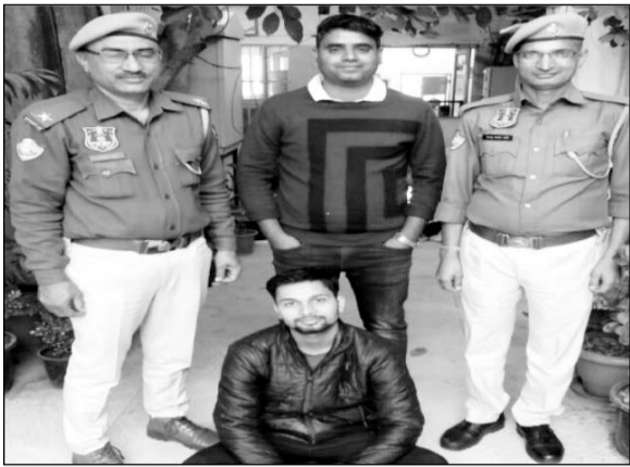
सिंधी कैप थाना पुलिस ने युवती को जहर देकर मारने वाले शातिर आरोपी को गिरफ्तार किया।

जयपुर (कासं)। सिंधी कैप थाना पुलिस ने युवती को जहर देकर मारने वाले एक शातिर आरोपी को धर-दबोचा है। जिससे पुलिस पूछताछ करने में जुटी है।