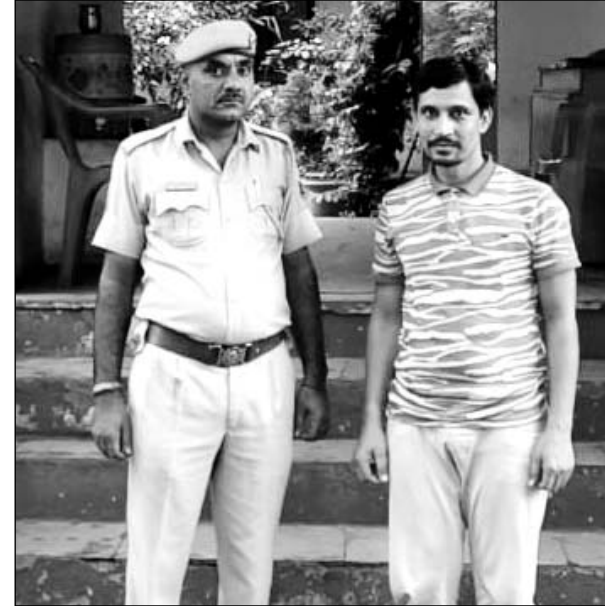
कुशलगढ़ थाना पुलिस ने अध्यापक भर्ती परीक्षा में डमी अभ्यर्थी बैठाकर चयन कराने वाले एजेंट को गिरफ्तार किया।