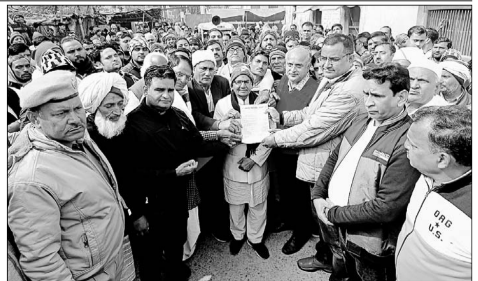
ग्रामीणों ने जिला बनाने की मांग को लेकर एसडीएम को सीएम के नाम ज्ञापन सौंपा।

ज्ञापन में बताया कि कामां एक धार्मिक नगरी जहां हर रोज हजारों