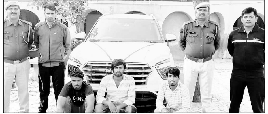
साइबर ठगों से कार बरामद कर उन्हें गिरफ्तार किया।

ठगों से आठ एटीएम कार्ड, चार मोबाइल, एक स्वाइप मशीन, 1,25,000 नकदी व एक कार जप्त की