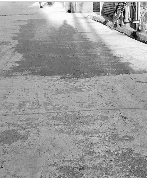
सुजानगढ़ सी.सी. सड़क पर खानापूर्ति के लिए लगाया गया डामर।