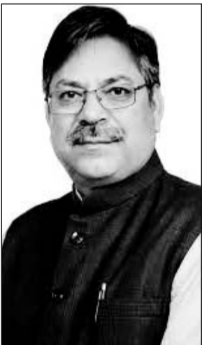
डॉ. सतीश पूनिया।

जानकारी के अनुसार भाजपा हरियाणा प्रभारी डॉ. सतीश पूनिया भाजपा के राष्ट्रीय नेतृत्व के निर्देश पर हरियाणा विधानसभा चुनाव में लगातार चार महीने तक हरियाणा प्रवास पर रहे, जहां उन्होंने माइक्रो मैनजमेंट के जरिये चुनाव प्रबंधन से लेकर संगठन की मजबूती के लिए राजनीति पर काम किया, जहां प्रधानमंत्री नरेंद्र मोदी के नेतृत्व में भाजपा की प्रचंड बहुमत की भाजपा की डबल इंजन सरकार बनी। हरियाणा विधानसभा चुनाव में भाजपा