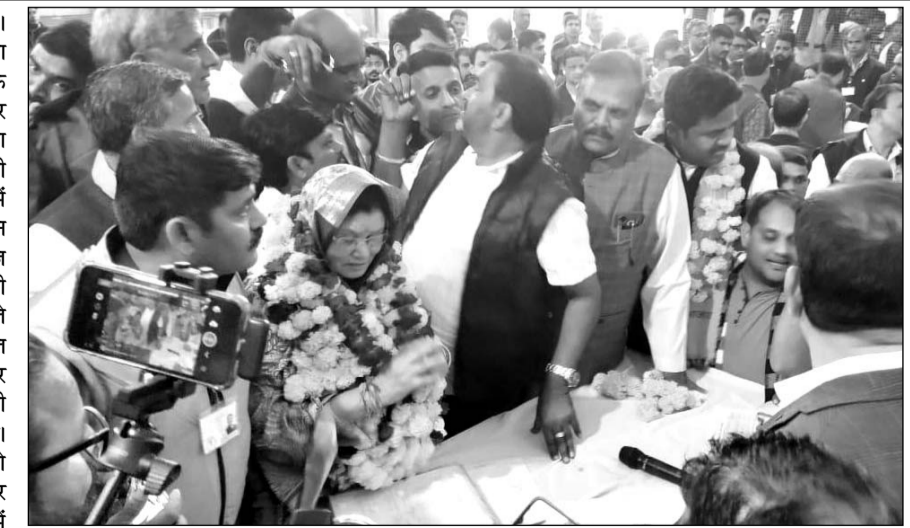
सलूमबर उपचुनाव की मतगणना के बाद विजयी प्रत्याशी की रिटर्निंग अधिकारी ने घोषणा की।

उल्लेखनीय है कि सलूमबर विधानसभा के 2023 में हुए चुनाव