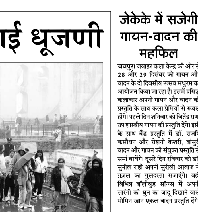
गुलाबी नगरी जयपुर में क्रिसमस व न्यू ईयर सेलिब्रेशन और सर्दी की छुट्टियों का लुफ्त उठाने आये पर्यटकों ने शुकवार को बारिश के बीच जंतर-मंतर देखने का आनंद लिया।

मैनचेस्टर, 27 दिसंबर। पेनल्टी स्पॉट पर एलिंग हालैंड की विफलता और ब्रूनो फर्नांडिस के रेड कार्ड ने प्रीमियर लीग की दो दिग्गज टीमों मैनचेस्टर सिटी और मैनचेस्टर यूनाइटेड की मुश्किलें बढ़ा दीं जबकि लीवरपूल को लीसेस्टर के खिलाफ ऐसी किसी समस्या का सामना नहीं करना पड़ा। लीवरपूल ने एनफिल्ड में कोहरे के बीच खेले गए मैच में एक गोल से पिछड़ने के बाद वापसी करते हुए लीसेस्टर पर 3-1 से जीत हासिल की। इस जीत से टीम ने 7 अंक की बढ़त के साथ अंकतालिका में पहले स्थान पर अपनी स्थिति मजबूत कर ली है। लीवरपूल के 17 मैचों में 42 अंक हैं जबकि दूसरे स्थान पर काबिज चेलसी के नाम 18 मैचों में 35 अंक हैं। सिटी को एवर्टन के खिलाफ घरेलू मैदान पर 1-1 से ड्रॉ खेलकर अंक साझा करने पर मजबूर होना पड़ा।