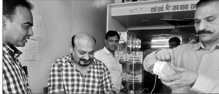
कोटा में खाद्य सुरक्षा विभाग की टीम ने नमूने लिये।

कोटा, (निर्स)। कोटा में 988 किलोग्राम गुलाब जामुन सीज करने की कार्रवाई की गई। साथ ही विभिन्न खाद्य पदार्थों के 19 नमूने लिये गये हैं।