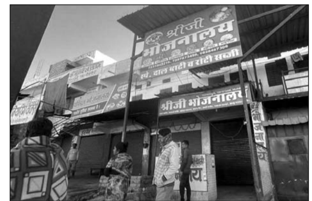
उदयपुर नगर निगम ने नगरीय विकास कर को लेकर कार्रवाई की।

उदयपुर, (का.सं.)। उदयपुर नगर निगम ने बुधवार सुबह नगरीय विकास कर को लेकर कार्रवाई करते हुए एक अपार्टमेंट को सीज किया। व्यवसायिक गतिविधियों वाली इस संपत्ति पर करीब नौ लाख रुपए का टैक्स बकाया था।