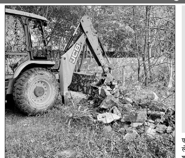
जेडीए की प्रवर्तन टीम ने दुर्गापुरा स्थित आयुष्मान सिंह नगर के सरकारी पार्क में किये गए अवैध निर्माण को ध्वस्त किया।

-कार्यालय संवाददाता- जयपुर। दुर्गापुरा इलाके में महारानी फार्म रोड पर स्थित आयुष्मान सिंह नगर में सरकारी पार्क की करीब एक बीघा जमीन पर भूमाफियाओं ने कब्जा कर पट्टा भी ले लिया, लेकिन नगर निगम के अधिकारी आंखें बंद किए बैठे रहे।