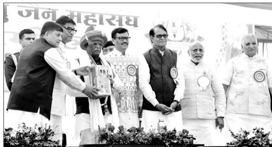
समारोह के दौरान राज्यपाल हरिभाऊ किशनराव बागड़े का स्वागत सम्मान किया गया।

राज्यपाल बागड़े ने अपने उद्बोधन में कहा कि राजस्थान अपने इतिहास के गौरव में ही नहीं बल्कि मंदिर स्थापत्य में भी अग्रणी है। नागौर के समीप बना गगनचुंबी माताजी मंदिर भी अपनी कला में अग्रणी है। उन्होंने कहा कि मां भवानी माता की पूजा के साथ-साथ करुणा, दया, चेतना, दृष्टि जैसे गुणों का विकास होता है। संसार के संचालन के लिए भी