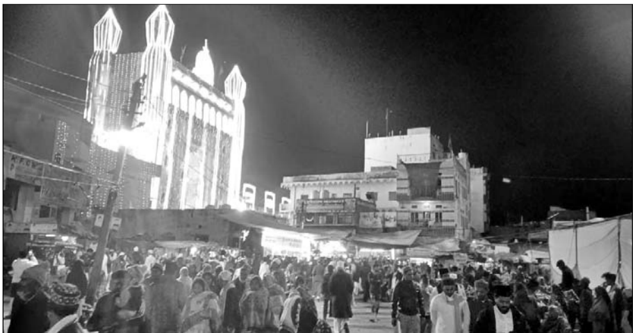
सालाना उर्स के मौके पर शनिवार को बड़ी तादाद में जायरीन दरगाह में पहुंचे।

सरवाड़, (निसं)। शहर स्थित हजरत खाजा मोइनूद्दीन चिश्ती के बड़े साहबजादे हजरत खाजा फखरुद्दीन चिश्ती की दरगाह के सालाना उर्स की विधिवत शुरुआत होने के साथ ही दरगाह में विभिन्न धार्मिक रस्मों की भी शुरुआत होने लगी है।