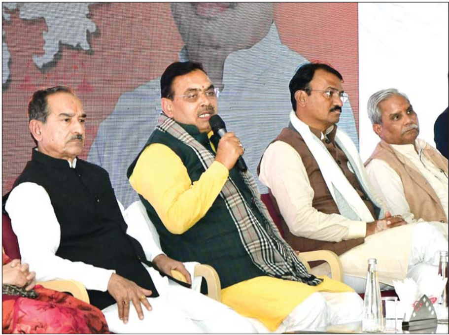
मुख्यमंत्री भजनलाल शर्मा ने भाजपा विधायक दल की बैठक की अध्यक्षता की। | विधायकों को संबोधित करते हुए उन्होंने कहा कि प्रदेशवासियों की आवश्यकताओं को पूरा करना हमारी सर्वोच्च प्राथमिकता है।

मुख्यमंत्री भजनलाल शर्मा ने कहा, सदन में नये विधायकों को मौका मिलेगा व सीनियर विधायकों के अनुभव का उपयोग होगा