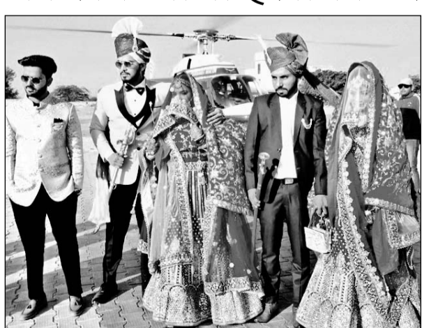
चूरू के सनसिटी रिसोर्ट से दुल्हन की विदाई हैलीकाप्टर में हुई।