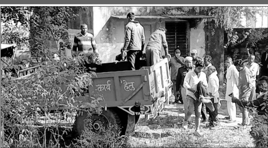
मृतक का सीएचसी पर पोस्टमार्टम कराती पुलिस।