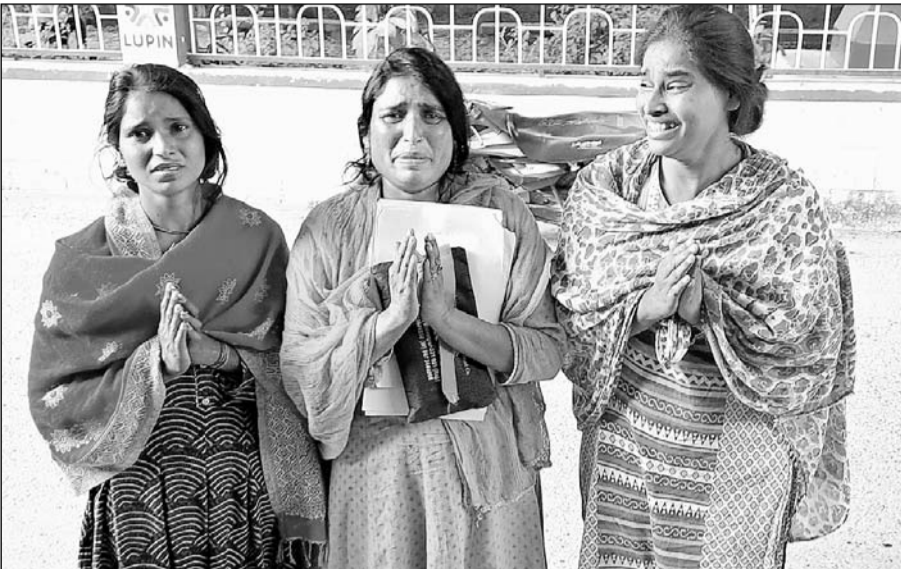
धौलपुर कलेक्टर से आवास की सुरक्षा की मांग करते परिवार के सदस्य।

गुलाब बाग धौलपुर में करीब 60 वर्ष पूर्व से रह रहा था बीपीएल परिवार