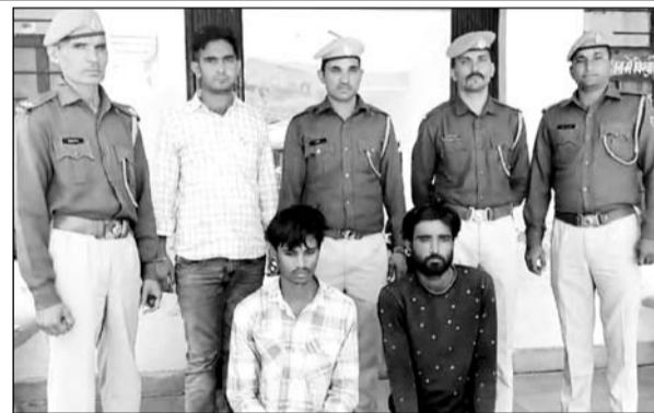
पुलिस ने कालबेलिया गैंग के दो सदस्यों को गिरफ्तार किया।