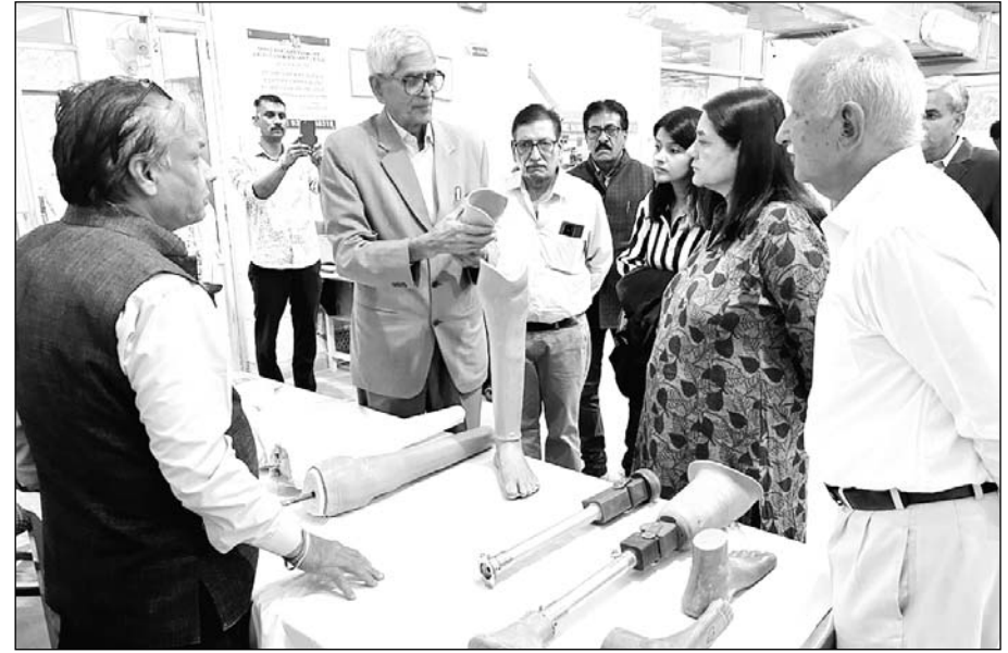
पूर्व केन्द्रीय मंत्री और भारतीय जनता पार्टी की वरिष्ठ नेता मेनका गांधी ने भगवान महावीर विकलांग सहायता समिति में विश्व प्रसिद्ध जयपुर फुट की निर्माण विधि देखी।

जयपुर। पूर्व केन्द्रीय मंत्री और भारतीय जनता पार्टी की वरिष्ठ नेता मेनका गांधी ने भगवान महावीर विकलांग सहायता समिति (बी.एम.वी.एस.ए.) में विश्व प्रसिद्ध जयपुर फुट की निर्माण विधि देखी।