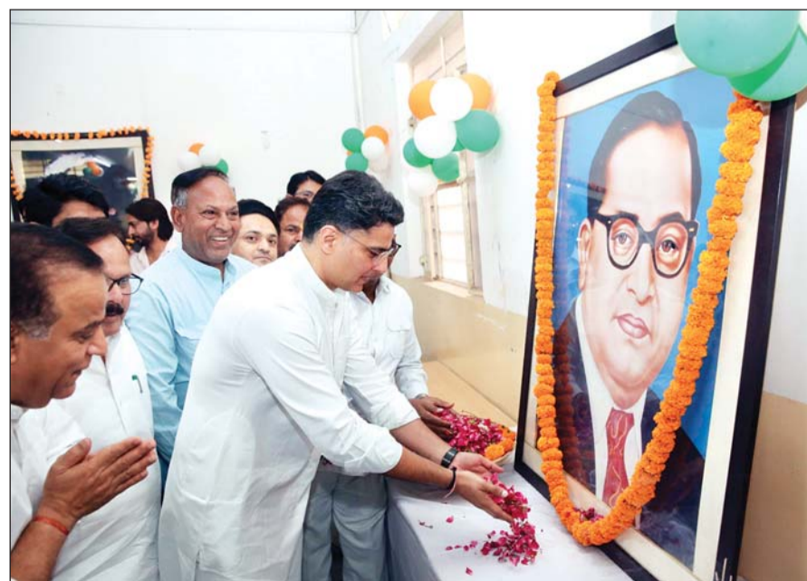
कांग्रेस के राष्ट्रीय महासचिव एवं पूर्व उपमुख्यमंत्री सचिन पायलट मंगलवार को प्रदेश कांग्रेस मुख्यालय में बाबा साहेब की जयंती पर आयोजित पुष्पांजलि कार्यक्रम में शामिल हुए।

पायलट ने कहा कि कांग्रेस पार्टी महिलाओं को अधिकार देने के लिए प्रतिबद्ध रही है। उन्होंने बताया कि मनमोहनसिंह सरकार के दौरान सोनिया गांधी के नेतृत्व में महिला आरक्षण विधेयक तैयार किया गया था, लेकिन उस समय यह पारित नहीं हो सका। उन्होंने कहा कि वर्तमान में सरकार इस दिशा में कदम उठा रही है, तो परिसीमन