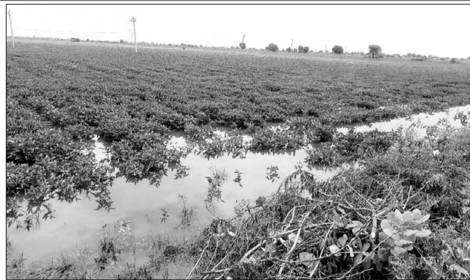
इटावा क्षेत्र के एक खेत में पानी में डूबी फसल।

किसानों ने बताया कि क्षेत्र में हालांकि अगस्त माह में हुई लगातार बारिश से फसलें खराब हो गयी थी थोड़ी बहुत आस थी लेकिन अब तो वह भी खत्म हो गयी। इस समय उड़द की फसल तो बिल्कुल सूख कर पक चुकी है कटाई का समय है लेकिन बारिश से