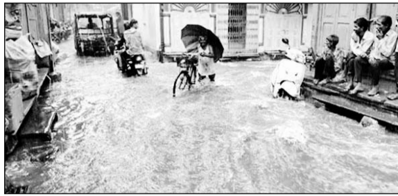
बुधवार दोपहर में झमाझम बारिश के बाद तेज बहाव से बहता पानी व उससे गुजरते वाहन व आमजन।

डूंगरपुर, (निसं)। जिले में पिछले दो दिनों से एक बार फिर मानसून की मेहर हो रही है हालांकि बारिश का यह दौर फसलों के लिए तो विशेष नहीं रहेगा लेकिन अभी भी रीते पड़े गेसागर जलाशय में थोड़ी बहुत राहत जरूर दे जायेगा। बीते 24 घंटे में जिले में सर्वाधिक बारिश फलोज में 64 एमएम रिकॉर्ड की गई है।