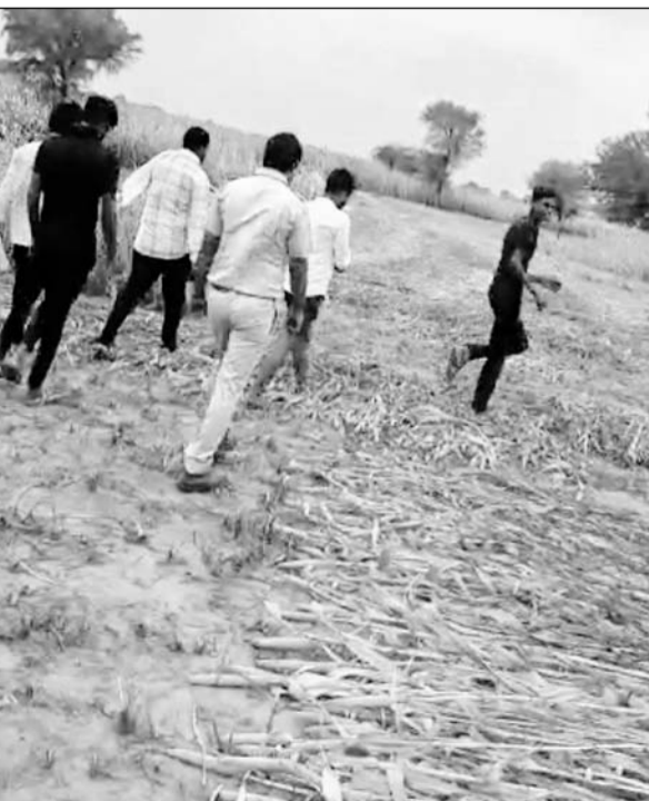
किसान व पुलिस की टीम ने पैथर को बाजरे के खेत में तलाश।

पैथर दिखने की सूचना पर स्थानीय महिला पुरुष, पुलिस और वन विभाग की टीमों ने पहुंच कर तलाश शुरू की लेकिन पैथर का अभी तक पता नहीं चल सका। टीम एवं ग्रामीणों का मानना है कि सम्भवतः पैथर झाड़ियों में पिछकर बैठा है। गौतलब है कि पूर्व में वन विभाग की टीम बकरे के साथ पिंजरा लगा चुकी है लेकिन पैथर वन विभाग व ग्रामीणों की हलचल से हर बार ओझल हो जाता है। पिछले 2 माह से क्षेत्र के चौसला गांव में पैथर का किसी ना किसी रूप में मूवमेंट दिखाई दे रहा है तब से लेकर आज तक ग्रामीण दहशत के माहौल में है।