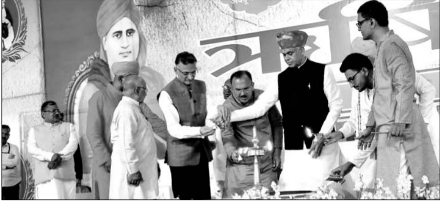
गुजरात के राज्यपाल आचार्य देवव्रत ने ऋषि मेले का शुभारंभ किया।

देवव्रत ने कहा कि लोग देसी गौमाता, प्राकृतिक कृषि और पर्यावरण के संरक्षण का संकल्प लेंगे। महर्षि दयानन्द सरस्वती की 200 वीं जयंती इसी मिशन के साथ मनाई जा रही है। आर्य समाज सदा से ही समाज व देश सेवा में अग्रणी रहा है। महर्षि दयानन्द सरस्वती जो देश के बड़े समाज सुधारक और सांस्कृतिक मूल्यों के संस्थापक, संस्कृति के प्रचारक रहे हैं उनके विचार जनमानस तक पहुंचे इस