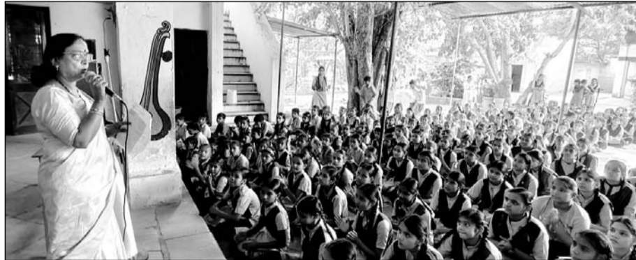
पांच हजार से अधिक बालिकाओं एवं विद्यार्थियों को "आवाज दो" कार्यक्रम की विस्तृत जानकारी दी।