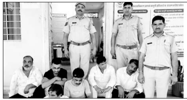
बरोनी थाना पुलिस ने जुआरियों को गिरफ्तार किया।

निवाई, (निर्स)। बरोनी थाना पुलिस ने ताश पत्ती पर जुआ खेलते छह जनों को गिरफ्तार कर 41540 रुपए की राशि व ताश पत्ती जब्त की है।