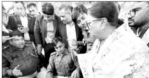
जानकारी मिलते ही वसुंधरा राजे घायल पुलिसकर्मीयों के पास पहुंची।

पाली, (नि.सं.)। पाली जिले में पूर्व मुख्यमंत्री वसुंधरा राजे के काफिले की एस्कोर्ट कर रही पुलिस की जीप पलट गई। हादसे में कुछ पुलिसकर्मी घायल हो गए, जिन्हें बाली के राजकीय अस्पताल में भर्ती कराया गया है।