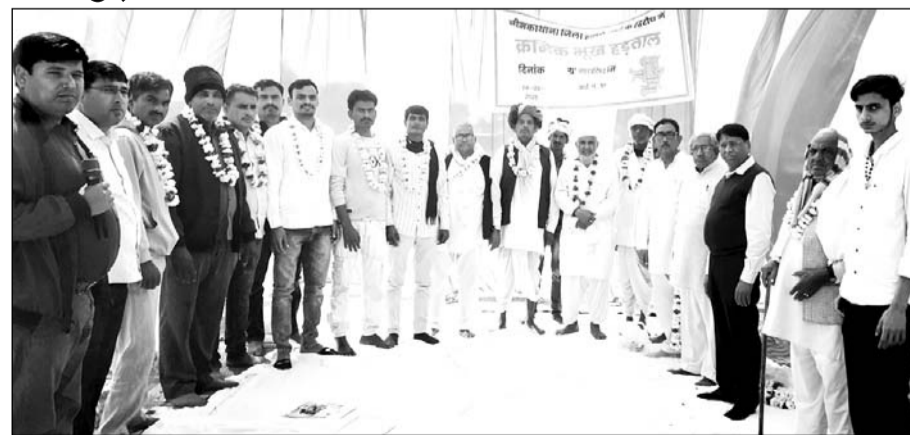
नीमकाथाना को पुनः जिला बनाने की मांग को लेकर धरना जारी रहा।