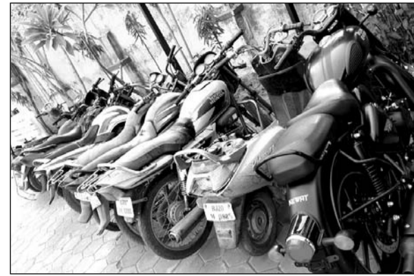
कबाड़ियों के पास कागजात नहीं मिलने पर 10 दुपहिया वाहनों को थाने पर लाकर खड़ा किया।