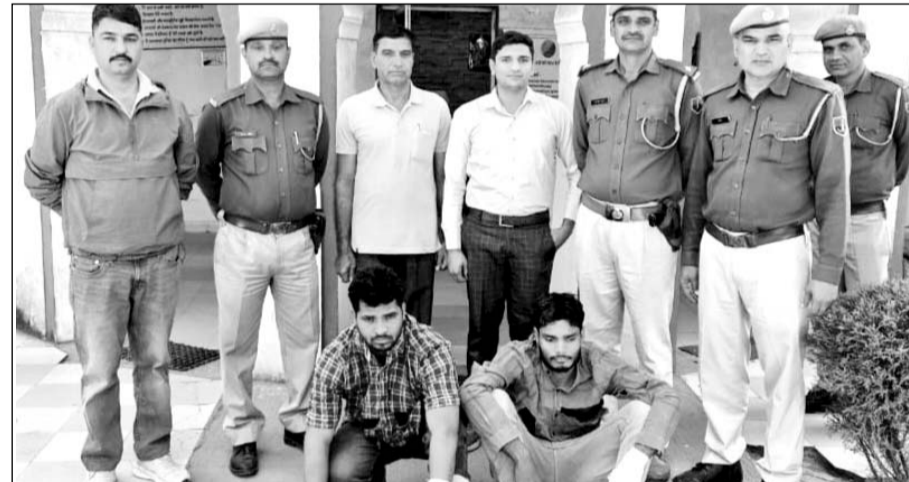
पुलिस ने दोनों आरोपियों को गिरफ्तार कर चोरी की वारदातों का खुलासा किया।