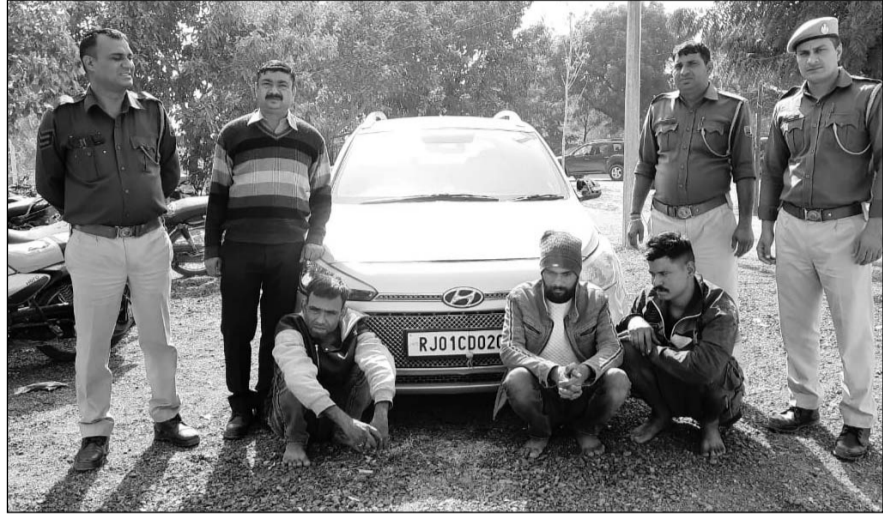
अजमेर में आदर्श नगर थाना पुलिस ने स्मैक तस्कर को गिरफ्तार कर कार जप्त की।