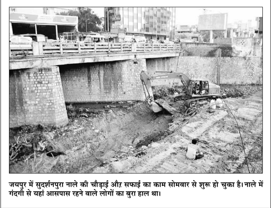
जयपुर में सुदर्शनपुरा नाले की चौड़ाई और सफाई का काम सोमवार से शुरू हो चुका है। नाले में गंदगी से यहाँ आसपास रहने वाले लोगों का बुरा हाल था।