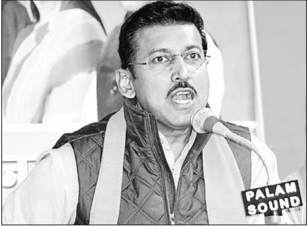
भाजपा के राष्ट्रीय प्रवक्ता राज्यवर्धन सिंह राठौड़ सोमवार को प्रदेश कार्यालय पर प्रेस से रूबरू हुए।

जयपुर। भाजपा के राष्ट्रीय प्रवक्ता राज्यवर्धन सिंह राठौड़ ने सोमवार को भाजपा कार्यालय में पत्रकार वार्ता के दौरान कहा कि राहुल गांधी की यात्रा में उनके फोटो के साथ ‘धर्म की जय हो, अधर्म का नाश हो’ स्लोगन लगे पोस्टर पर राठौड़ ने कहा कि जब धर्म की रक्षा के लिए जब एक ऑरिजनल पार्टी (भाजपा) है तो तो फिर फेक पार्टी की जरूरत क्या है? धर्म का कोपीराइट तो भाजपा के पास है। कांग्रेस पायरेटेड कॉपी है। हालांकि उन्होंने यह भी कहा कि अगर कांग्रेस धर्म के रास्ते पर आ रही है तो अच्छी बात है। वहीं राठौड़ ने कहा कि 500 करोड़ रुपए राहुल गांधी की रिलॉचिंग पर लग रहे हैं। राजस्थान के नौजवानों की नहीं, एक 50 साल के बच्चे की पांचवीं बार इमेज रिलॉचिंग हो रही है। इस देश के नौजवानों में अपार क्षमता है। लेकिन फिर भी इस देश का