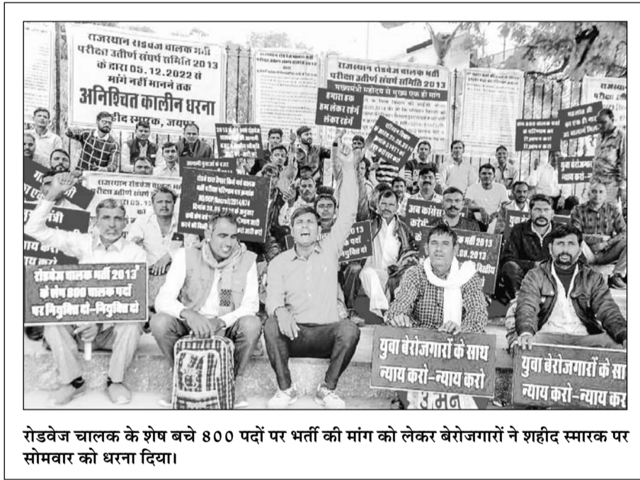
रोडवेज चालक के शेष बचे 800 पदों पर भर्ती की मांग को लेकर बेरोजगारों ने शहीद स्मारक पर सोमवार को धरना दिया।