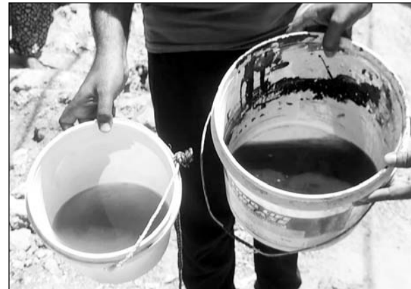
नलों में आ रहा काला पानी।

भीलवाड़ा, (निस)। पवित्र रमजान के महीने में भीलवाड़ा शहरी क्षेत्र के सांगानेरी गेट में लोगों के घरों में नलों में नाले का गंदा काला पानी आ रहा है। पानी में इतनी भीषण दुर्गंध है कि उससे हाथ-मुँह भी धुलना मुश्किल हो रहा है। क्षेत्र में तमाम लोगों की तबीयत बिगड़ने लगी है। क्षेत्र के लोग भीषण गर्मी के इस मौसम में बूंद-बूंद पानी को तरस गए। स्थिति यह है कि कामकाज के लिए तक पानी नहीं है।