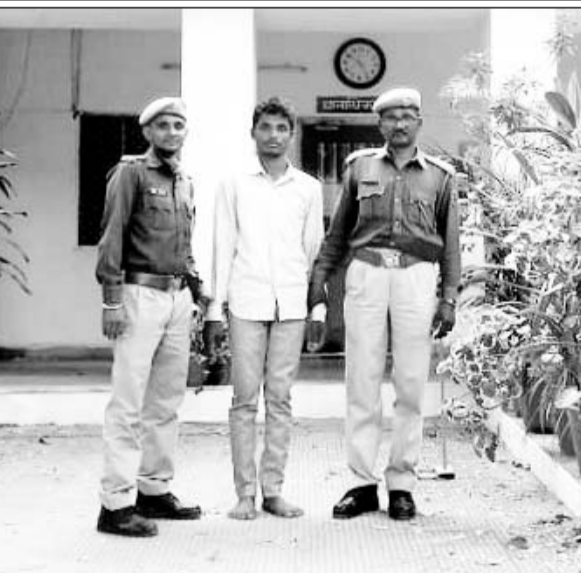
कोतवाली थाना पुलिस की गिरफ्त में आया मोटर साईकिल चोरी करने का आरोपी।