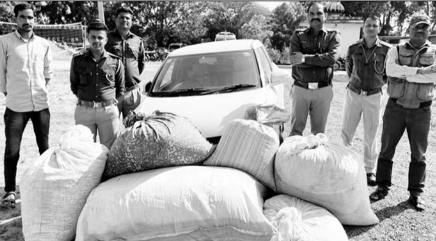
नाकाबंदी तोड़कर भाग रहे तस्करों पर पुलिस ने फायरिंग की।

उदयपुर, (कासं)। गोगुन्दा थाना पुलिस ने तलाशी अभियान के दौरान नाकाबंदी तोड़ तस्करि कर भाग रहे तस्करों पर पुलिस दल ने फायरिंग की। जिससे टायर बस्ट होने पर तस्कर कार छोड़ कर फरार हो गए।