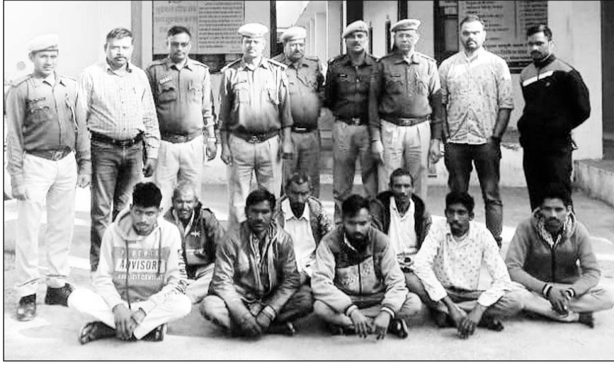
सदर थाना पुलिस द्वारा कांकारी डूंगरी प्रकरण में उपद्रव करने के मामले में गिरफ्तार किए गए आरोपी।

डूंगरपुर, (निर्सं)। गत सितम्बर 2020 में हुए कांकारी डूंगरी प्रकरण के बाद सदर थाना क्षेत्र के भुवाली एनएच-8 पर कतिपय उत्पातियों द्वारा रास्ता जाम करने व सरकारी वाहनो को नुकसान पहुंचाकर पुलिस पर पथराव करने के मामले में एक वर्ष से फरार चल रहे 8 आरोपी को सोमवार को गिरफ्तार किया गया। उल्लेखनीय है कि इस मामले में सदर तथा बिछीवाडा थाने में लगभग 4 हजार व्यक्तिगणों पर उत्पात मचाने, सरकारी सम्पत्ति को नुकसान पहुंचाने तथा विभिन्न मामलों में प्रकरण दर्ज हुए थे।