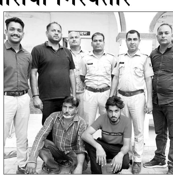
पुलिस ने अवैध मादक पदार्थ सहित दो तस्करों को गिरफ्तार किया।